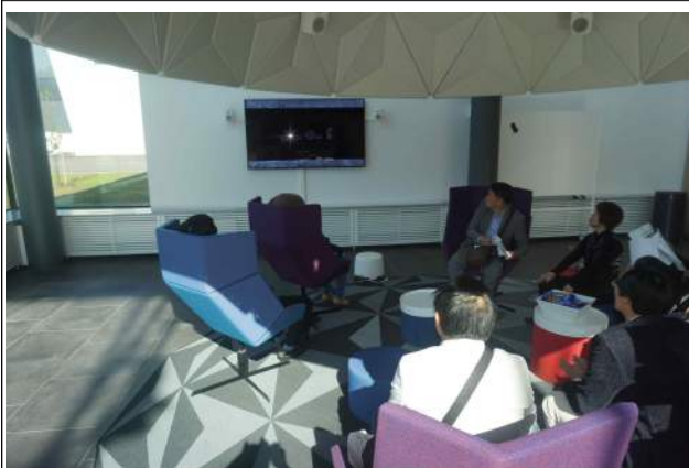
재활용하는 과정 시청