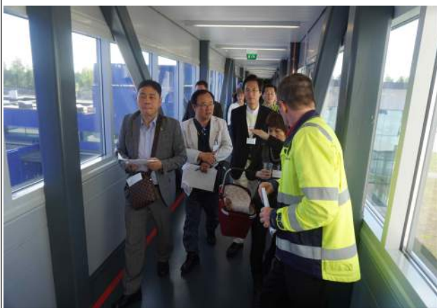
소각시설 견학 위해 이동