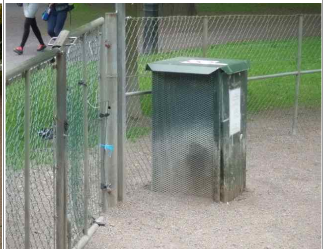
분비물함(함 옆에 삽이 있음)