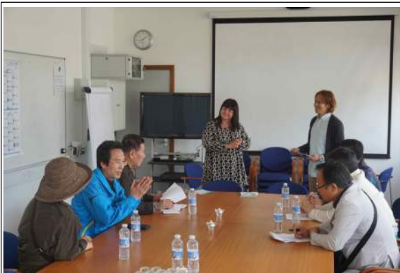
시설 현황 설명