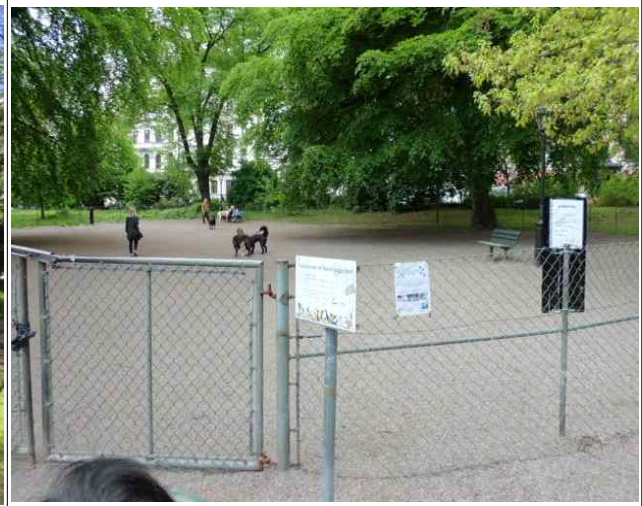
애완견 보호소 입구