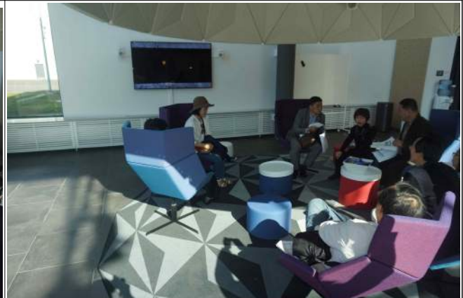
영상 시청 후 토론

아닌 무조건 혼합인데 그 중 20%는 못 태운다. 나무 50%, 플라스틱 20%이다. 소각장 관계자 분은 아주 자신 있게 “가장 큰 시설이며, 제가 보기에는 가장 아름다운 시설이