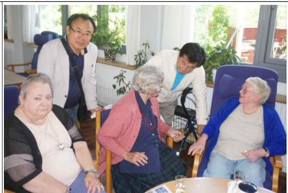
복지센터에 기거 중인 분들