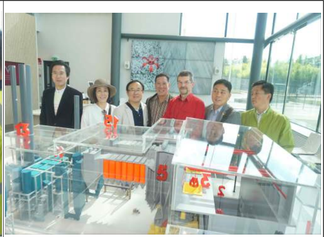
쓰레기 재활용 사진