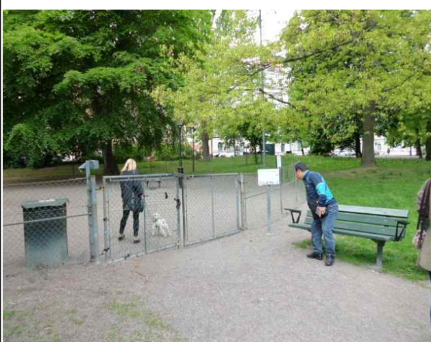
애완견 보호소 밖