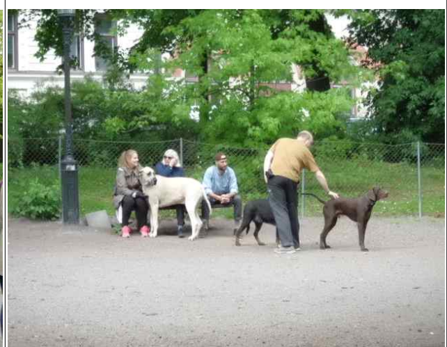
애완견 보호소 안에 있는 모습