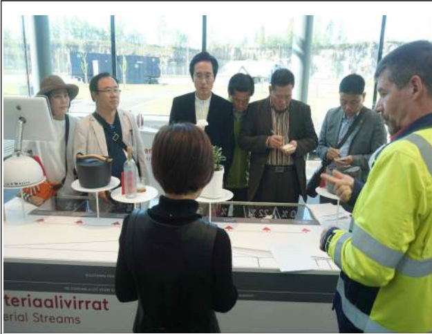
소각장 담당자 현황 청취