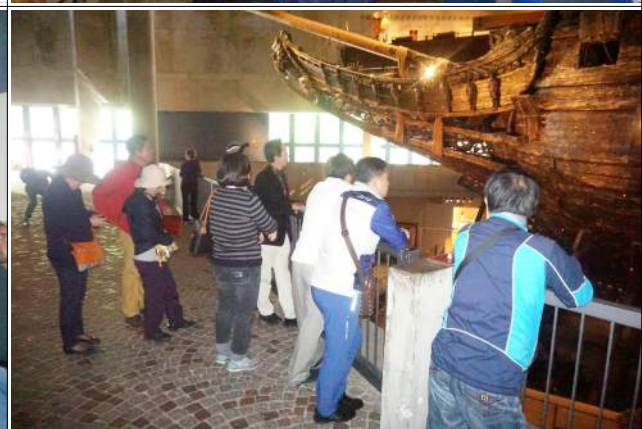
구스타프 2세 시대인 1625년에 건조되어 1628년 8월 10일 처녀항해 때 스톡홀름항에