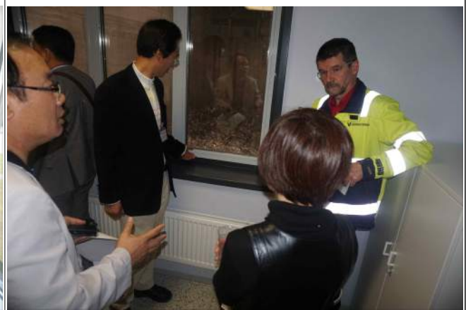
소각 처리 과정 견학